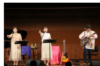
歌とピアノでほっこりコンサート

※ 4月3日(土)10:00から応募説明会を、ゆめたろうプラザ 情報考房で開催します