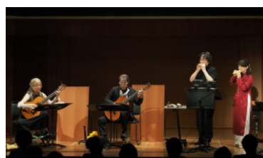
オカリナ・ギター・テルミンの癒しの音楽