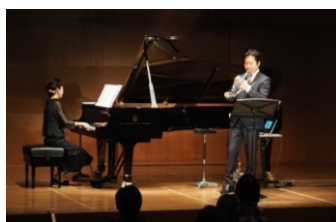
トランペットとピアノの優しい音色