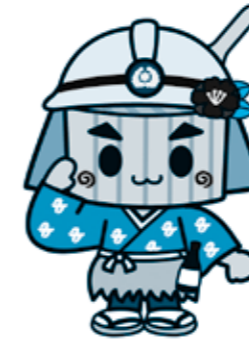
武豊町マスコットキャラクター みそたろう