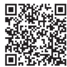
武豊町電子申請届出システム

武豊町電子申請・届出システムより申請ができます。申請は町ホームページ、または右のQRコードから可能です。