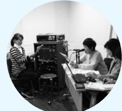
▲「かえるの声」による録音の様子