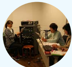
▲「かえるの声」による録音の様子