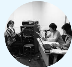
▲「かえるの声」による録音の様子