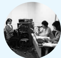
▲「かえるの声」による録音の様子