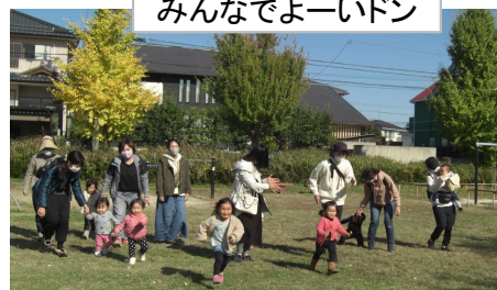
みんなでよーいドン

天気の良い日は散歩や公園に出かけてみませんか。自然と直接触れることで子どもさんの五感は育まれていきます。親子でゆったり楽しい時間を過ごしてみてください。