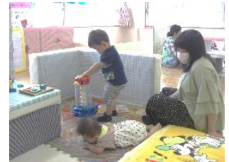
北部支援センター