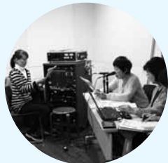
▲「かえるの声」による録音の様子