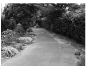
▲砂川一丁目・二丁目第1号線

長さですが、この近辺は独立専用自歩道が多く、この路線の始点・終点は、他の道路と交差しながら、さらに別の独立専用自歩道につながっています。 この道路は別名を「よこまくらみち」といい、両脇に木々の茂った静かな道です。中ほどでは砂川公園の入り口にも面しています。散歩の途中などに、ふと立ち寄ってみるの也不错かもしれません。