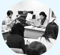
▲「かえるの声」によるテープ録音