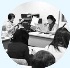
▲「かえるの声」によるテープ録音