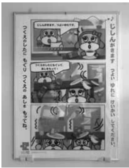
▲ 保育園児用のパネル (西保育園)