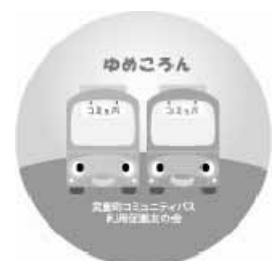
ゆめころん缶バッジ

HP http://www.town.taketooyo.lg.jp/ (武豊町ホームページ)