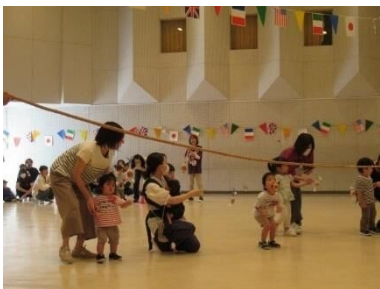
親子ふれあいひろば うんどうかい