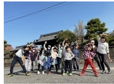
ラジオ体操で世代間交流