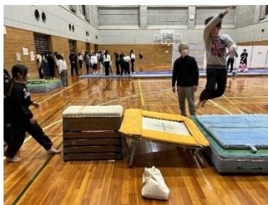
総合型地域スポーツクラブの教室