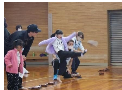
たけとよスポーツDay