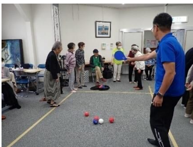
憩いのサロンでのスポーツ