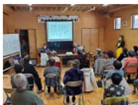
中山サロン（歌謡ショー）