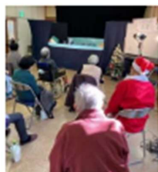
馬場サロン（人形劇）