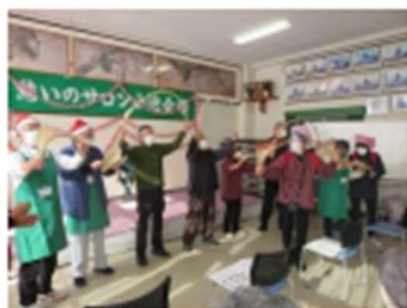
小迎サロン（南京玉すだれ）