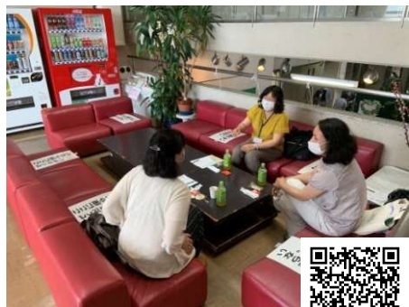
リフレッシュカフェ