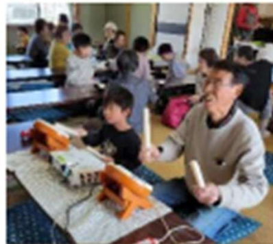
おいでん北山（太鼓の達人）