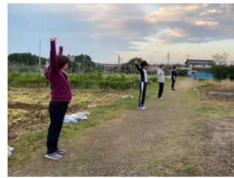
ラジオ体操富貴茶ノ木