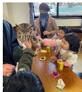
よし子さん家（陶匠）