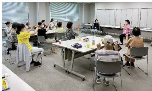
あれあれモーニング