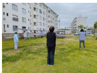
なかよし体操クラブ