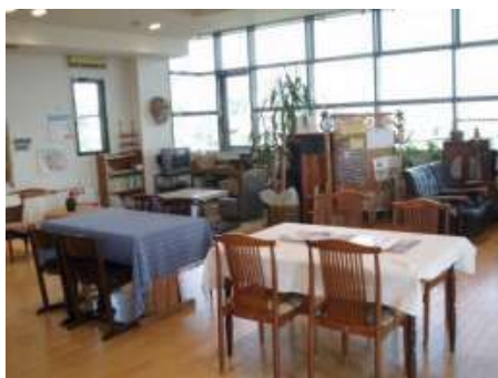
地域活動支援センター ひろばわっぱる