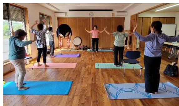
市原健康体操クラブ