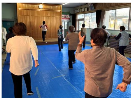
富貴市場健康体操