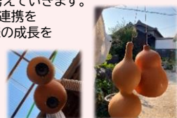
ひょうたん スピーカー

遊び、学習、趣味や夢に向かった活動などを一緒にいき、お子様一人一人が生きていく力をつけていけるように必要な支援を提供する場です。お子様、ご家族と相談しながらお子様の生活を考えていきます。学校、関係機関と連携を取りながらお子様の成長を支えていきます。