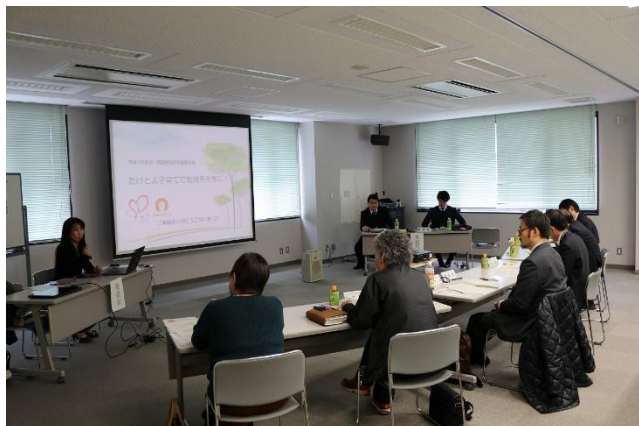
▲公開プレゼンテーションの様子