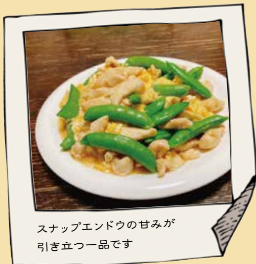
スナップエンドウの甘みが引き立つ一品です