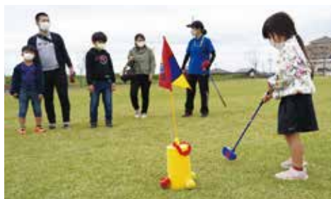
昨年のニュースポーツ体験会の様子