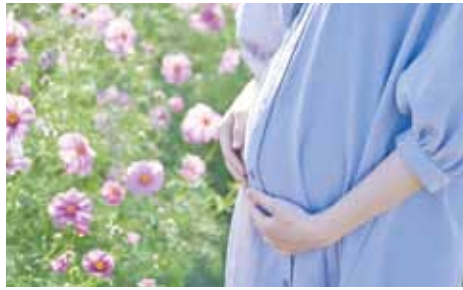
▲安心して子育てできる武豊に

お子さんと保護者が安心して生活できるように、最善の方法を相談させて頂くなど、療育支援の充実に努めていきたい。