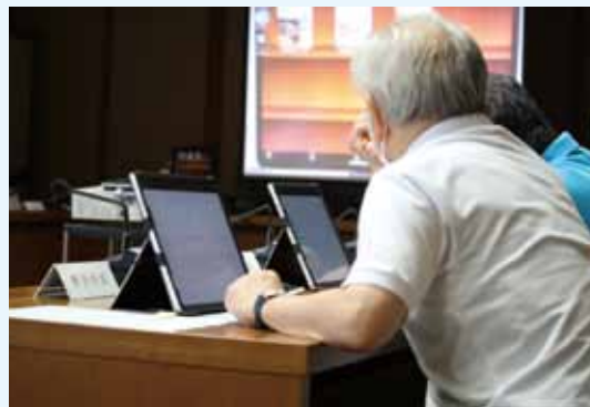
▲タブレット操作研修の様子

円滑な議会運営を目指し、議会ICT化プロジェクト委員会を設置し、使用するアプリケーションの検討や使用基準の作成などを行いました。また、納入後、すぐに使用できるようにタブレットの基本操作の研修を行いました。令和4年9月にタブレット30台が納入され、それぞれが持ち帰ることができるようになりました。