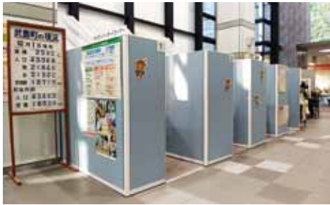
▲簡単親切なサポートコーナー

①カードには顔写真が添付。他人の使用はできない。 ②各種手続きをする場合登録した暗証番号が必要。