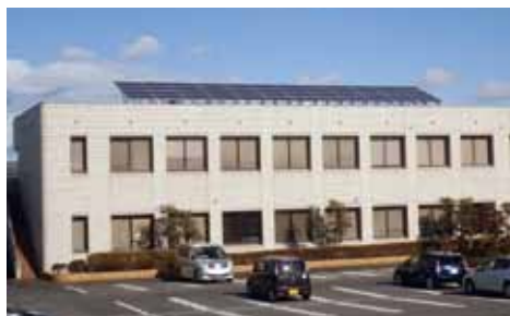
▲最初に設置された太陽光パネル

状況は保健センター、J R 武豊駅東駐輪場、富貴小学校、中山保育園、地域交流センター、屋内温水プールの6施設の屋根に設置している。2030年度までの設置目標は公共施設12か所に設置予定であるので、進捗率は50%である。