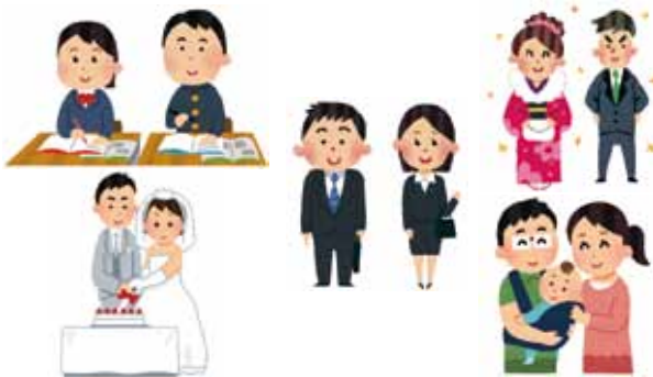
▲ AYA 世代の様々なライフワーク

A 現在、中学1年生には学校を通じてチラシの配布を、16歳には個別通知を送送している。チラシや通知文に追加して周知したい。他の個別周知は慎重に検討するが、まずは町ホームページや広報などで幅広い周知を図りたい。