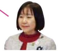
公明党議員団 甲斐百合子

AYA世代と呼ぶ15歳～39歳のがん患者にはライフステージに応じた支援が必要です。