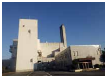
▲廃業の「クリーンセンター常武」

4点目は、新たに設置する「資源回収エコステーション」の屋根に、太陽光発電設備を設置し、必要な電気を確保するとともに、災害などの非常時でも活用できる施設整備を予定している。 5点目は、地元、北山区からのご意見・ご提言などを踏まえ、地域に開かれた施設となるよう調整を進めている。