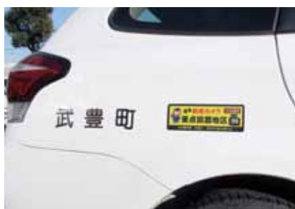
▲公用車に録画中ステッカー

A 町民の皆さんに掲示していただけるような親しみのあるステッカーの作成を、前向きに検討する。