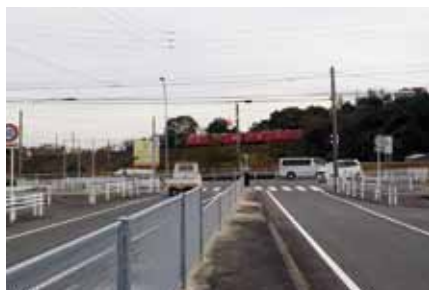
▲南進が求められる知多東部線

A 「土木事業に関する要望会」で愛知県に対し、臨港道路武豊線・武豊美浜線の4車線化整備および富貴西側特定土地区画整理事業で整備された寺西信号交差点