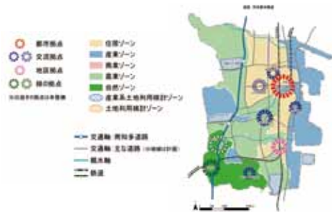
▲都市計画マスタープラン

A 企業庁との連携を想定した整備手法の調整を行うため、企画政策課にて実施したアンケート結果から得た企業ニーズを踏まえ事業候補地の選定を行う。