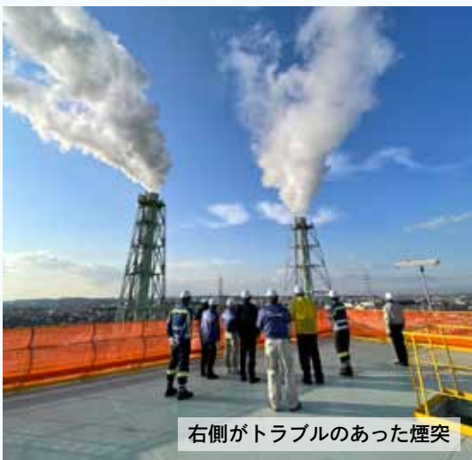
右側がトラブルのあった煙突

8月9日に名古屋第二発電所の煙突から飛散し た異物の原因について画像などで詳しく説明を 受けました。また対策については定期整備時の 点検項目とその内容が示されました。