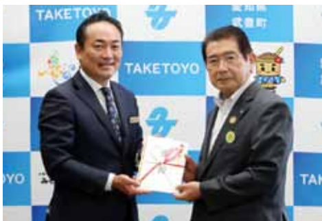
株旭モータース様 50万円