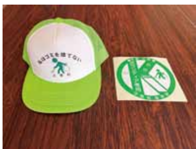
▲ボランティアシールと帽子

また、清掃活動を安全かつ効果的に行って頂くための支援として「私はゴミを捨てない」と帽子正面に記載した蛍光色の帽子を作成し、ゴミ拾いをして頂ける方や団体などで希望される方々へ無料で配布をしています。