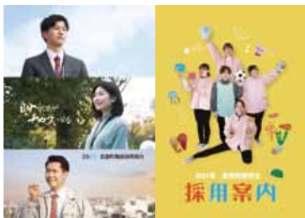
▲町職員が呼びかけるポスター