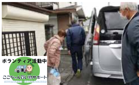
ボランティア活動中 ここちゃん買い物サポート