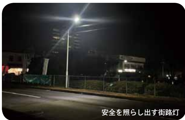
安全を照らし出す街路灯