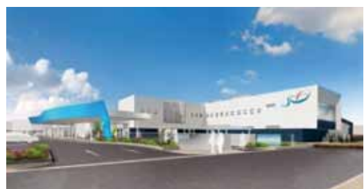
▲8500万円使用するプール

「検討会議」では、現在町が採用している「ごみを出す量」に応じて、処理にかかる費用を負担して頂く「排出量 単純比例型」と東海市などで採用されている出されるごみの一定量までは無料とし、超えて出されるごみには、排出量に応じて費用を負担する「一定量 無料型」を比較検討した。