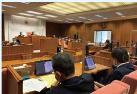
▲本会議でタブレットを使用！