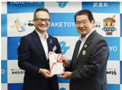
あいおいニッセイ同和損害保険様 10万円 ※他に、包括連携協定を締結