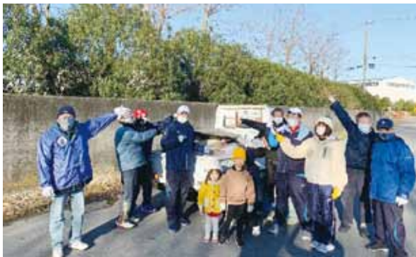
▲月一でポイ捨てごみを拾う「ポイ捨てゴミ拾い隊」

A 副町長 『ボランティアシール』をゴミ袋に貼ることで地区のゴミ集積所を利用したい。