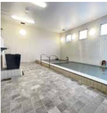
▲期待どおりの温浴施設？