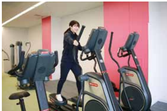
▲Let's運動!(屋内温水プールのトレーニング室)

A 福 令和3年度・令和4年度の特定健診受診者の内、糖尿病に関する数値が保健指導判