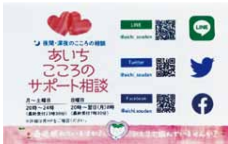
▲県が作成した案内カード

A 教 ひと言に居場所と言っても、町民が気負わずに多様な視点からの居場所が必要である。どのような形で推進していくのか、その方法については、今後、調査研究していきたい。