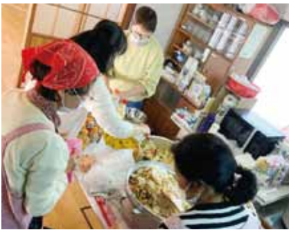
▲昨年11月にオープンした「いちじく子ども食堂」

予算化だけではなく、行政の信用力を活かした民と民の連携の後押しや、公民館などの活用を可能にするなど、行政しかできない支えを、一層お願いする。