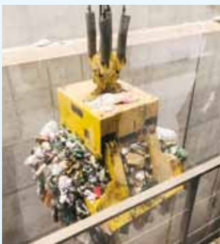
▲ごみクレーンのバケット

1日に283tのごみを焼却 焼却炉は2炉あり、1炉当たり141.5tで、1日283tのごみを焼却することができます。ごみピットの容量も災害などでごみが焼却できない場合でも7日以上のごみを溜めておくことができます。その他にもごみを焼却する際に発生する有毒物質を除去する薬剤やボイラーに必要な水なども7日分溜めておく設備を有しているそうです！