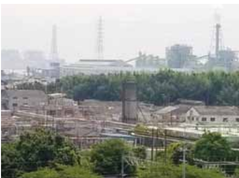
▲期待される企業誘致風景（想像）

A 企 大きな可能性をもったゾーンであること認識している。課題の整理を進めつつ企業ニーズの把握について準備を進める。