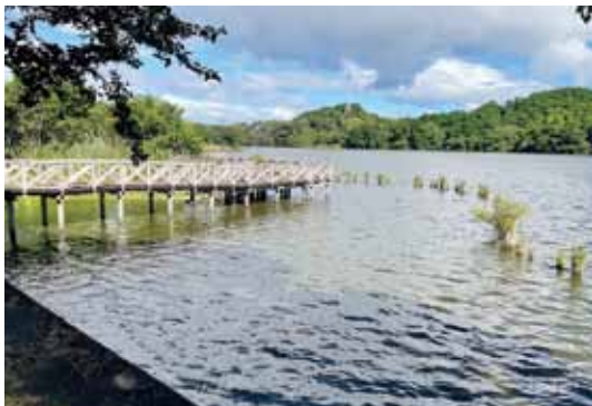
▲拠点の1つ、長成池公園景色

建 公園にはそれぞれ駐車場、トイレが整備され、散策の拠点として最適である。今後はさまざまな移動手段を想定した地域資源のネットワークの構築や北インターチェンジ周辺の民間事業者との連携も含め調査研究を行う。