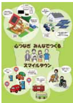
▲2030年の暮らしやまちのイメージ 武豊町温暖化対策実行計画

現在の環境学習を継続しつつも「エコスクール・プラス」を活用できるかどうか、学校施設の整備に併せ、環境・エネルギー教育の教材として活用できるか否かについて検討していく。