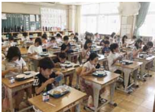
▲楽しい給食・・・値上げしないで！

A 町長 現在の物価高騰が住民の家計や生活を圧迫していることを憂慮している。給食費の値上げはさらに追い打ちをかけることになる。地方創生臨時交付金の活用も検討し、創意工夫をして現状維持に努めたい。