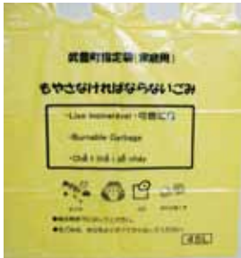
▲質問で無料化を求めたごみ袋

A 経 町全体に対して交付されるという認識を持つていることから、屋内温水プール事業に充当した。