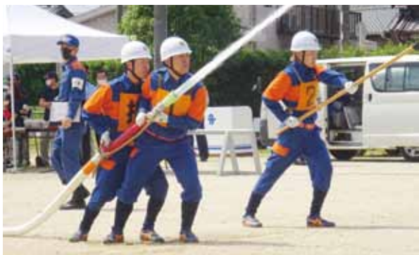
▲第2分団の小型ポンプ操法

A 総 消防団組織を維持していくためには、団員の負担軽減も重要と考えている。一例として、今年度の消防操法大会から、ポンプ車操法の部を辞め、小型ポンプ操法の部のみの開催とした。消防力を維持しながら、団員が活動しやすい環境を整えていくことが、新入団員の確保にもつながると考えている。