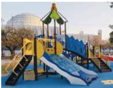
▲全国各地に広がるインクルーシブ公園

A 町長 整備予定のある公園や、既存の公園施設での改修で、遊具などを選定する場合に、調査研究をしていく。