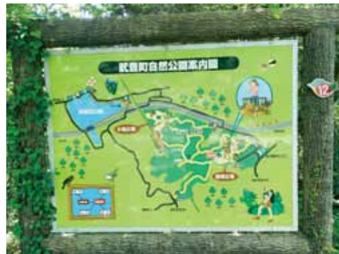
▲自然公園内の地図

A 建 利用者の安全のため一部の遊具を使用禁止としている。また、公園利用に支障となる木や枝などの剪定を随時実施している。今後も安全に使用できるように、維持管理に努めていく。