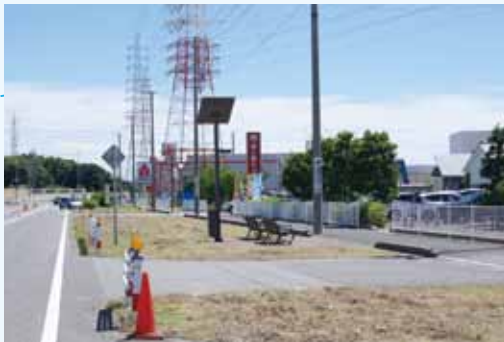
▲4車線化工事始まる