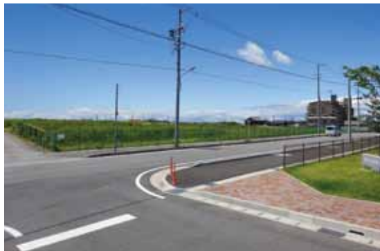
▲武豊中央公園南側

の移転事業である。武豊中央公園の南側に移転し、知多中部広域事務組合消防本部と調整をしながら事業を進めていく。