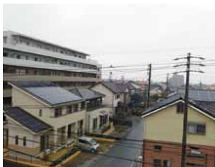
▲ 2030年までには新築戸建ての6割を太陽光発電設置目標

A 経 「武豊町住宅用地球温暖化対策設備設置費補助金制度」により、県と協力をし補助を行っている。