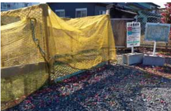
▲区民が管理するごみ集積所

A 総 今のところ考えていない。総合的な窓口としては総務課で対応し各課への案内をしている。