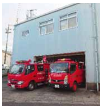
▲現第一南分団詰所

A 総 地域より個別に移転計画に関する説明の要望を頂いた場合には、当該地域の皆さんに説明する機会を設けたい。