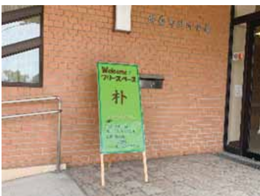
▲居場所が開催される砂川会館