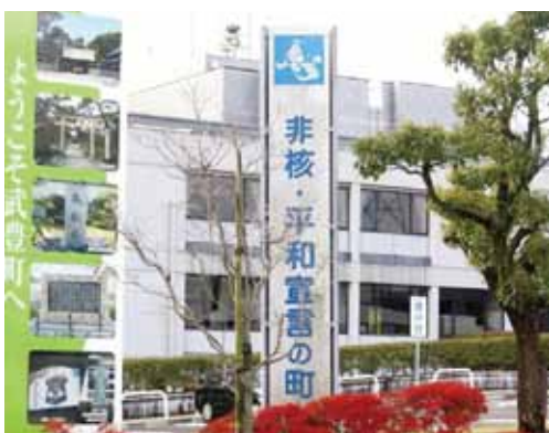
▲役場に設置されている啓発看板

A 総 本町が次世代継承として、行っている事業として、広島・長崎の原爆パネル展を開催しています。