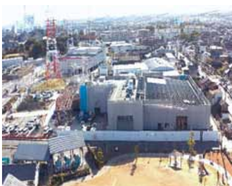
▲上空から見た 12月2日建設中の温水プール

A 教 15年という契約期間内には、様々な社会情勢の変化が見込まれる。状況を注視し、利用者へのサービス内容の低下につながらないように努める。