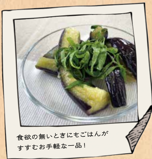
食欲の無いときにもごはんがすすむお手軽な一品!