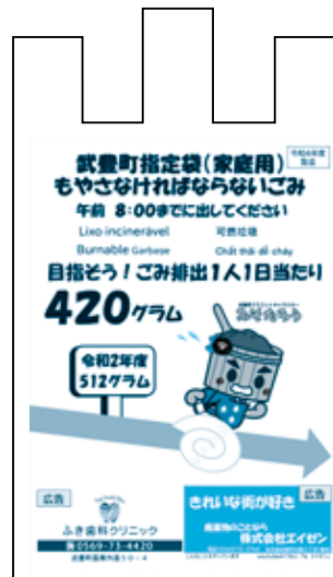
もやさなければならぬごみ用