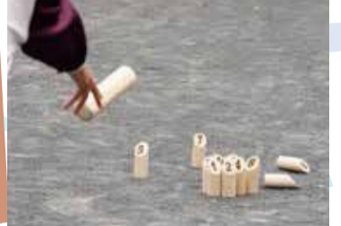
② ニュースポーツモルック体験