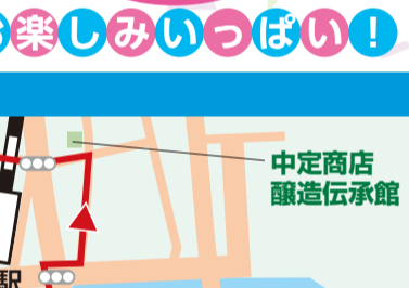
⑥ はたらくのりもの集合