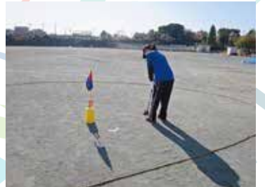
① ニュースポーツナッグゴルフ体験