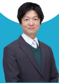
武豊町長 鳥羽 悠史