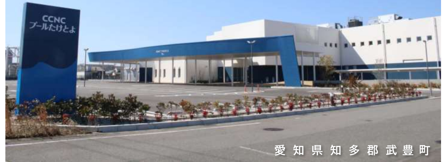
愛知県知多郡武豊町