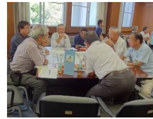
グループワーク(A班)