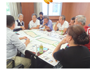
グループワーク(B班)