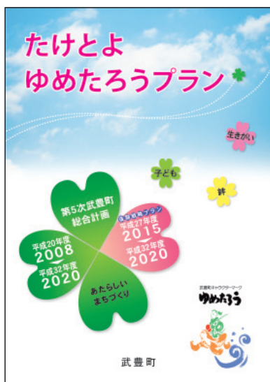
▲ 第5次武豊町総合計画

誘致候補地が少ないことも課題である。限られた土地のなかに、新たな候補地を探すなど、企業誘致にも取り組んでいく。