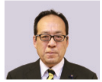
石川 義治 議員

財政状況は、総務省より全国自治体の情報が提供され、経年的な分析や類似団体の比較も容易にできるので、今後の予算編成や財政運営に活かし、住民にもわかりやすく公開していくことが重要である。