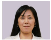
櫻井 雅美 議員

武豊町では0、1、2歳児の保育が始まった頃から、社会保険に加入していることが入所条件となつていました。フリーランスの方は入所できず、仕事ができなければ無収入となり、場合によってはその後の収入にも大きく影響してしまいます。