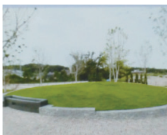
▲長久手市卯塚墓園樹木型合葬式墓所

A 町長 少子化やライフスタイルの変化に伴い、お墓や供養に対する意識が変わってきている。住民のみならずのニーズに合ったお墓の形態である樹木型などの整備について検討する時期に来ている。他市町の事例を参考にしながら、樹木葬などお墓に限定されない新たな供養スタイルを検討していく。