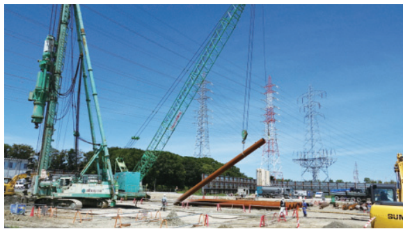
▲「中部電力武豊火力発電所5号機の建設工事現場」

Q 中長期財政計画の予測より2年早く不交付団体となったが、今後の財政計画への影響は。