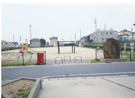
▲「祠峯公園を楽しむ会」が管理