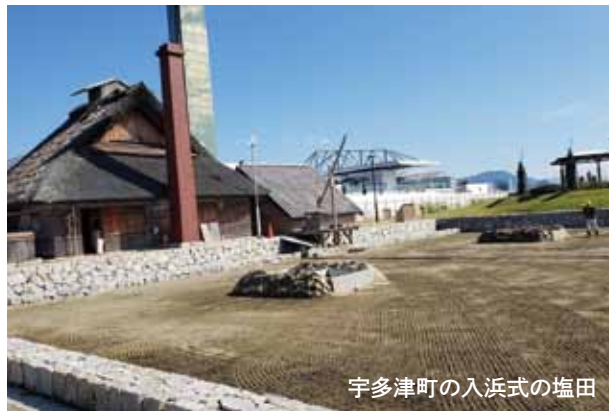
宇多津町の入浜式の塩田