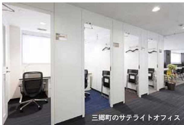
三郷町のサテライトオフィス

三郷町では、独自のネットワークシステムと駅に隣接したサテライトオフィスを、いなべ市では、住民に開かれた新庁舎を視察しました。