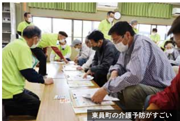
東員町の介護予防がすごい

元気に自立して日常生活を送ることができる健康 寿命を伸ばすことが大切です。先進的な取り組み を武豊町にも取り入れていきます！