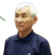
日本共産党議員団 梶田 進