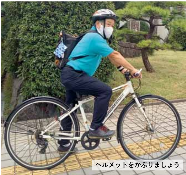
ヘルメットをかぶりましょう