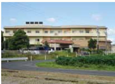
▲福祉避難所となる施設

Q 災害時、区の自主防災会との協力体制が非常に重要と考えるがどの様な体制を構築されているのか。