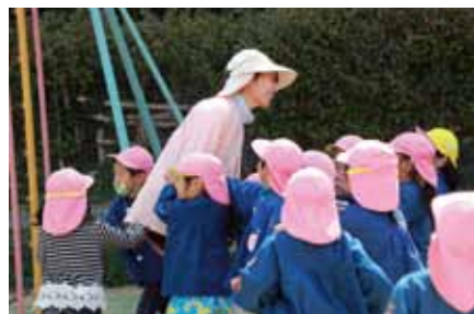
▲園児に愛される保育士さん

A 現時点では、 ・園児の登・降園の管理。 ・保護者への連絡・周知。 ・保育の指導計画・記録の策定等の業務について、導入する予定。 システム導入後は、大幅な時間短縮が見込まれており、一層の保育時間の確保に役立つと考えている。