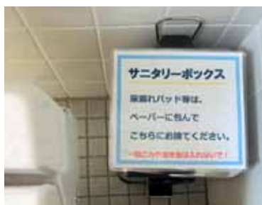
▲庁舎1階男子トイレに設置済

への設置についても順次進めていく。 また、他の公共施設においても、施設の実情に同じ、個室のうち少なくとも1カ所にはサニタリーボックスが設置できるよう、各施設管理者と情報共有を図り、今後設置に向け順次進めていく。