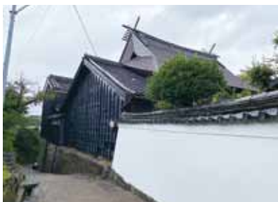
▲町指定有形文化財「三井家住宅」

▲山車や三井家住宅のような有形文化財保存修理事業に対する補助制度は、「武豊町文化財補助金交付要綱」の中で定められている。補助内容については、平成18年4月1日に改正され、現在は補助対象経費の2分の1以内、限度額475万円となっている。改正から15年が経過し、