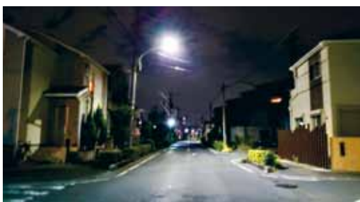
▲安心して暮らせる住宅地

A 県の見解によると、騒音や振動の発生源となる施設や設備は、性能の向上から、音や揺れの伝わり方も軽減する傾向にある。住宅なども防音機能が向上しており、規制緩和の方向にあり、県条例の改正も厳しい。町としても、コインランドリーを規制する合理的な理由が考え難いため、町独自の条例制定は難しい。