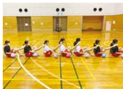
▲総合型スポーツクラブでの新体操

Q 現在の本町における学校での部活動の課題は。 A 教員の課題として専門外の部活動の指導や子育て中など個人の状況に違いがあり、負担を感じる場合がある。 Q 学校単位から地域単位への部活動の移行に際して、中学生の受け入れ先の形態は。 A 現時点では、特定の形態は想定していない。国の提言に基づき、愛知県の推進計画や近隣自治体の状況な