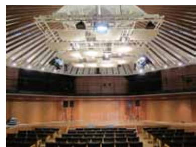
▲天井工事が待たれる響きホール

予定をしていた工事が入札不調により計画通り行われないのは住民にとって不利益である。