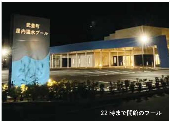
22時まで開館のプール