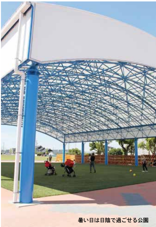
暑い日は日陰で過ごせる公園