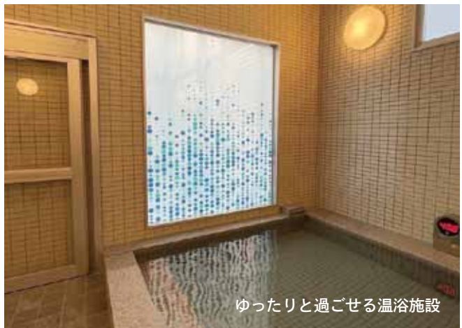
ゆったりと過ごせる温浴施設