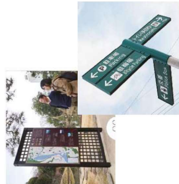
散策路案内サイン