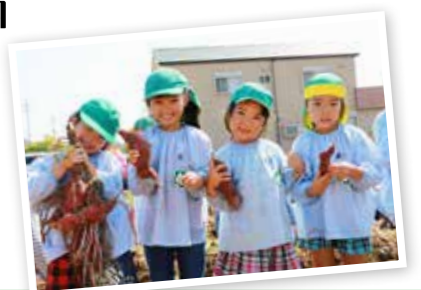
・祖父母会 ・芋ほり