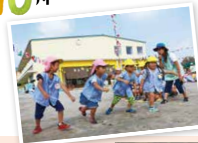
・運動会 ・遠足 ・保育参観日(年少)