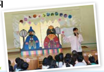
・ひな祭り会 ・お別れ会 ・卒園式