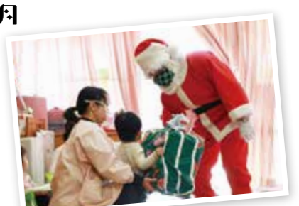
・クリスマス会 ・保育参観日(年中)