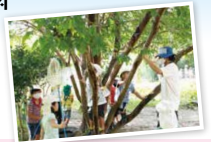
・保育参観日(全園児) ・園児引き渡し訓練 ・年少親子給食会