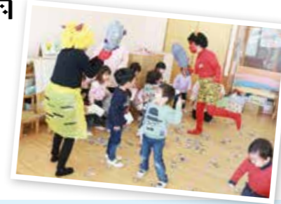
・豆まき会 ・保育参観日(年長)