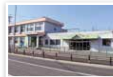
● 南部子育て支援センター(わくわく)