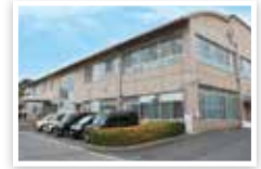
● 北部子育て支援センター(すくすく)