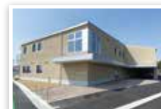
● あおぞら園(児童発達支援)