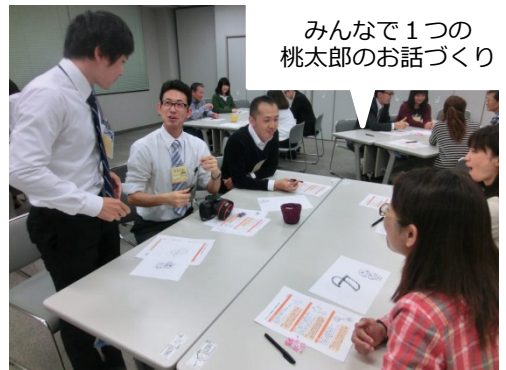
みんなで1つの 桃太郎のお話づくり