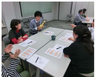
笑顔がいっぱいでした！！