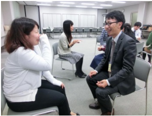
2人1組で、名前にまつわるエピソードをお互いに紹介