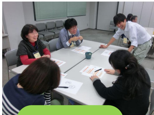
何よりも自分が楽しんで やるのが大事！