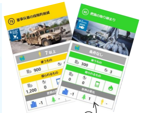
プロジェクトカード