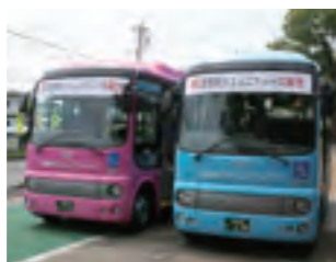
③記念すべき第一便

平成6年10月 第1回武豊ふれあい山車まつり開催 ※① 10月 武豊町キャラクターマーク「ゆめたろう」制定 平成7年8月 武豊町消防団第一南分団が第40回愛知県消防操法大会で優勝 ※② 平成8年9月 知多東部線開通 平成9年3月 武豊交番開所 平成10年7月 役場窓口業務延長サービス試行実施 平成11年3月 武豊町ホームページ開設 平成12年6月 人口が4万人を突破 平成13年8月 武豊町海外派遣事業開始(ケアンズ) 平成14年10月 旧国鉄武豊線転車台復元記念式典挙行 ※③ 平成15年12月 やすらぎの森墓園第一期工事完工