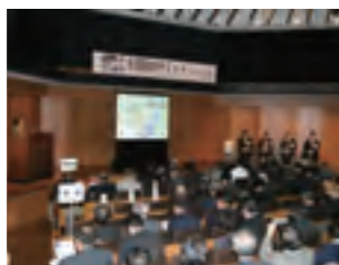
②パネルディスカッション