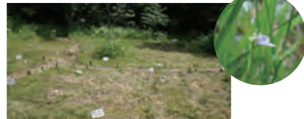
①老町田湿地植物群落