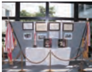
②展示された優勝旗や楯