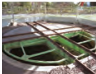
③貴重な鉄道文化遺産