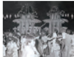
③参加者全員で盆踊り