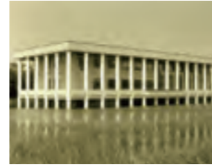
②希少な水上図書館