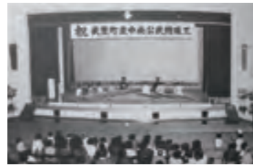
①竣工記念芸能大会