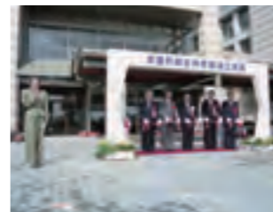
④竣工披露テープカット

昭和49年6月 人口が3万人を突破 昭和50年2月 半田消防署武豊支署業務開始 昭和51年4月 中央公民館完工 ※① 昭和52年10月 名鉄知多武豊駅新築 昭和53年1月 第1回苗木まつり開催 昭和54年10月 町民憲章制定 ※② 昭和55年8月 第1回ふるさとまつり開催 ※③ 昭和56年7月 知多郡随一の規模を誇る武豊中屋内運動場完成 昭和57年4月 世帯数が1万世帯を突破 昭和58年4月 運動公園開園 ※④ 12月 武豊高校ラグビー部が全国大会に出場 ※⑤