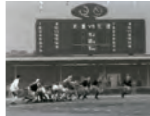
⑤武豊高校対天理高校(近鉄花園ラグビー場)