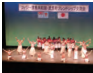
①フィジー民族芸能を披露