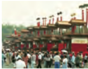
①衣浦小学校に11台が集結