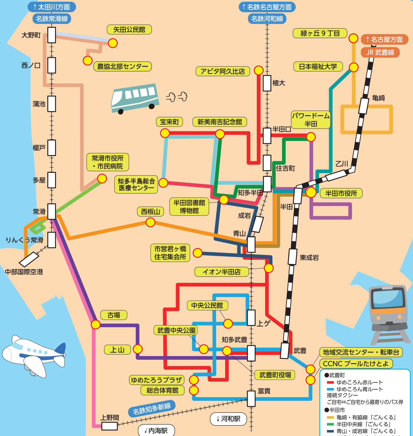
青山駅ロータリー内停留所位置について