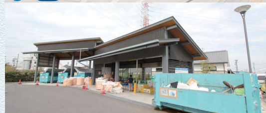
7 G9 おおし資源回収エコステーション