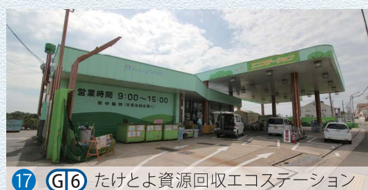
17 G6 たけとよ資源回収エコステーション