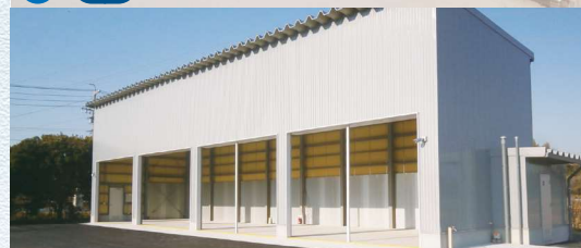
82 I16 いちはら資源回収エコステーション