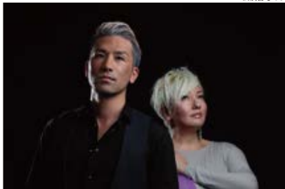
ツインヴォーカル・ジャズユニット 「SOLO-DUO」