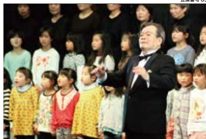
合唱構成 「どうれっしゃがやってきた」