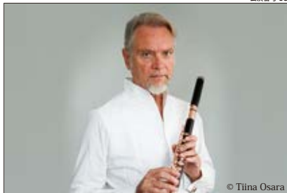
パトリック・ガロワ フルート・リサイタル