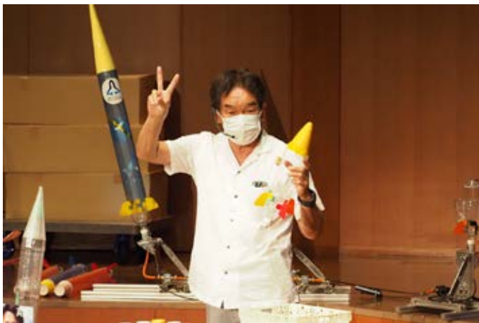
ファンダメンタル：2回打ち上げるよ