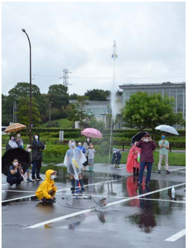
ファンダメンタル：雨二モ負ケズ