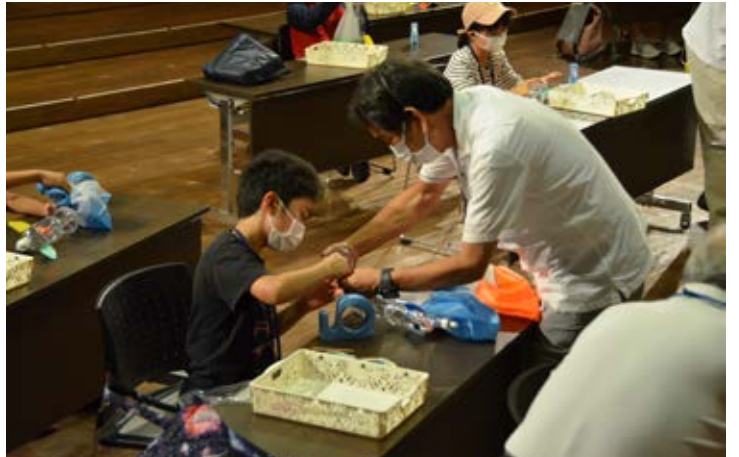
ファンダメンタル：難しいところはお手伝いしてもらったよ