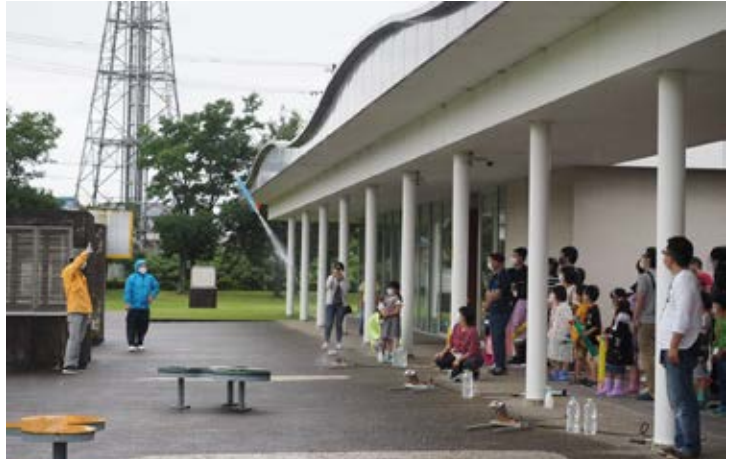
キッズ：1. 2. 3. 発射！