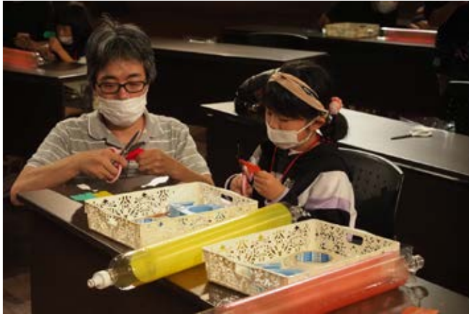
キッズ：親子で作業しました