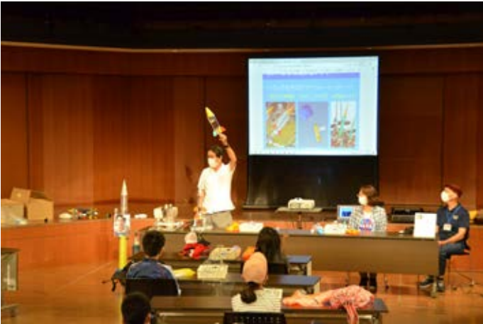
ファンダメンタル：このロケットを作ります