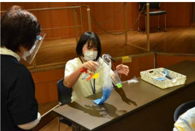
ファンダメンタル：パラシュート実験。上手く開くかな？