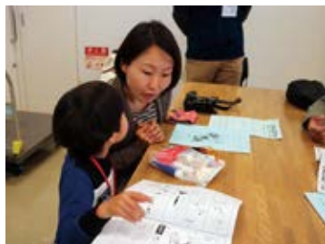
ママと一緒に作ったよ

午後からは大会のルール説明を聞いてから、作ったモデルロケットで打ち上げ大会に臨みました。2019年は風が強く、絶好の打ち上げ日和とは言えない天候で、パラシュートが開かなかったり、大きく計測範囲からはみ出しだりましたが、みんな真剣にロケットの方向をセッティングして楽しい打ち上げ大会となりました。優勝者には賞状とトロフィーが贈られました。