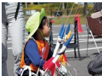
風を読んで向きを決める