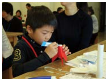
ボンドの作業は特に慎重に