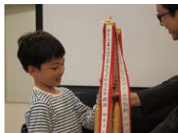
日油株式会社の研究開発部長さんからトロフィー授与