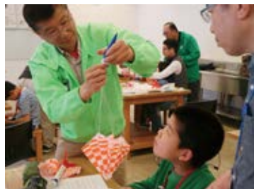
大事なところはスタッフも一緒に確認