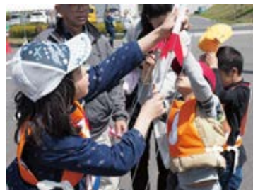
ロケットの向きを決めるのも自分