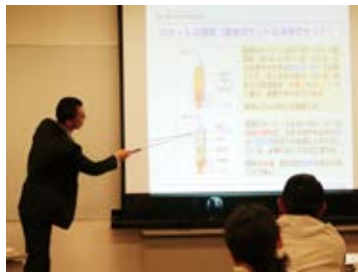
ますます興味がわいてくる

日油株式会社社員のロケット博士による「ロケット講座」では、スライドを使ってロケットの歴史や仕組みなどをわかりやすくお話をしてくれました。