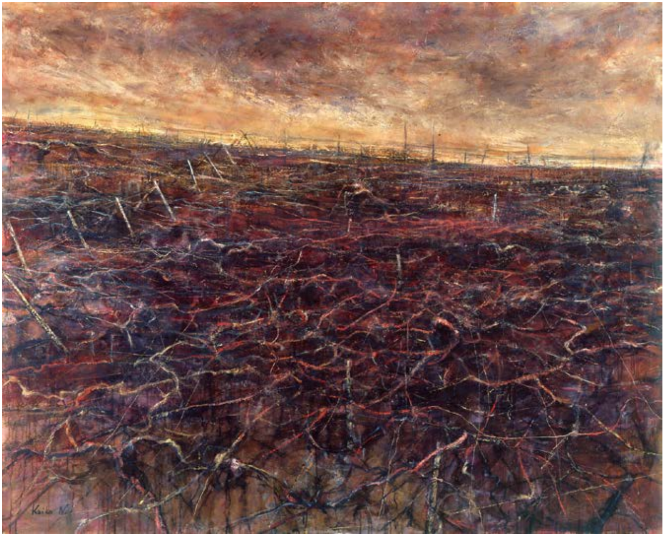
中島佳子 《ぶどう棚風景》 100F (130.3×162.1cm) 1981年作

主催: 武豊町「文化芸術による創造のまち」支援事業実行委員会 共催: 武豊町教育委員会 協力: 株式会社 名古屋画廊、特定非営利活動法人 武豊文化創造協会