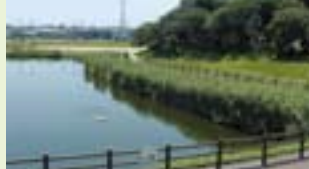
Parque com lago de Besso (Besso ike koen) 別曾池公園 MAP J-3