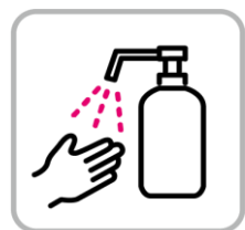
アルコール消毒液の配置 Installation of alcohol disinfectant