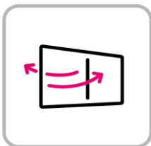
換気の徹底 Thorough ventilation