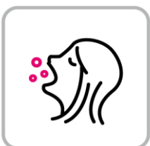
スタッフのうがい徹底 Gargle thoroughly whenever possible