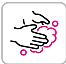
手洗いの徹底 Practice proper handwashing