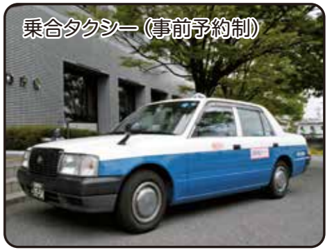
乗合タクシー(事前予約制)