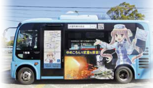
武豊町コミュニティバスゆめころん