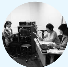
▲「かえるの声」による録音の様子